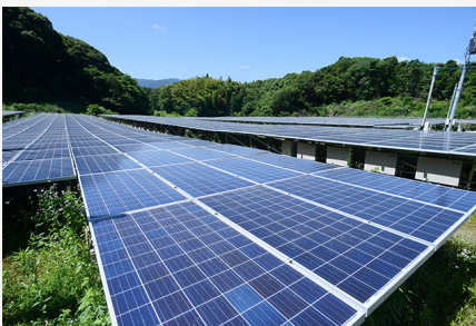
再生可能エネルギー